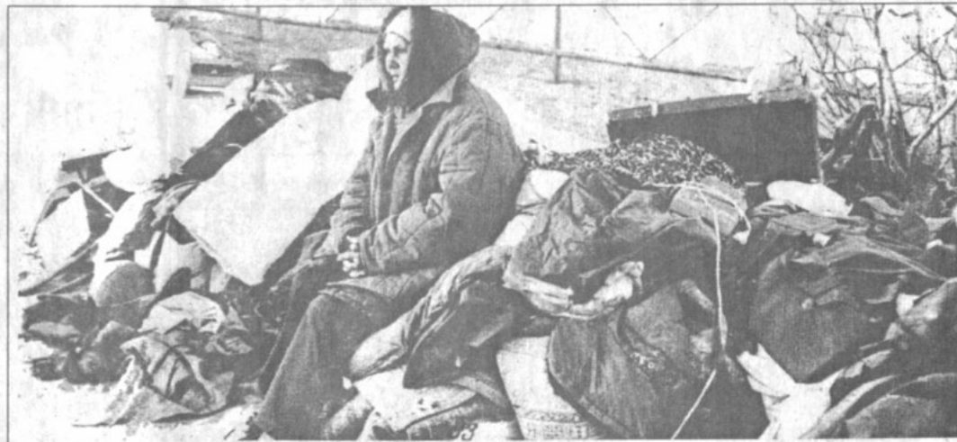
На руинах родного поселка.

Сегодня дань памяти погибшим семь лет назад землякам будет отдана и в Южно-Сахалинске — с 13 до 14 часов у памятника жертвам нефтегорского землетрясения, расположенного в сквере у железнодорожного вокзала, состоится траурный митинг.